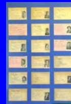
La Resistenza italiana I (Tesserini ANPI, Associazione Nazionale Partigiani d'Italia)