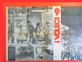
La sinistra extraparlamentare II ( I volsci , luglio 1979)