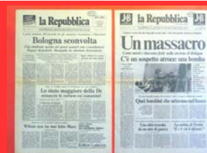
Bologna: uccisione di Francesco Lorusso e strage del 2 agosto ( La Repubblica , 12 marzo 1977 e 3 agosto 1980)