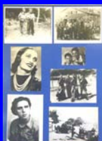
La Resistenza italiana II