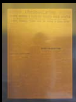
La marcia su Roma ( Il resto del Carlino , 30 ottobre 1922)