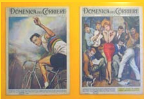
Lo sport e l'intrattenimento di massa ( La domenica del Corriere )