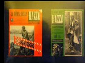
Regime e politica razziale ( La difesa della razza )