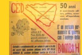
La paura dell'atomica (manifesto)