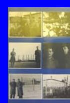
Gli IMI, Internati Militari Italiani