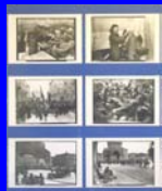
Gli americani in Italia