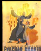
Guerra civile spagnola III (Manifesto repubblicano)