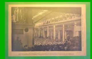
Il "biennio rosso" ( L'illustrazione italiana , settembre 1920)