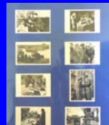
Gli inglesi in Italia