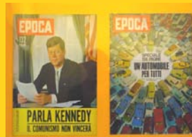
La Guerra fredda e la società dei consumi ( Epoca )