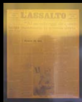
Il Governo in mano a Mussolini ( L'Assalto , 18 novembre 1922)