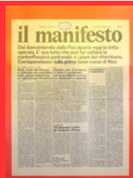
Il gruppo de Il manifesto (Anno 1, n. 1, 28 aprile 1971)