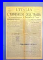
L'armistizio ( L'Italia , 9 settembre 1943)