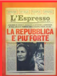
La strage di piazza Fontana ( L'espresso , 21 dicembre 1969)