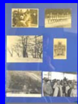
La Resistenza italiana III