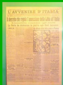
La guerra italo-turca ( L'avvenire d'Italia , 18 ottobre 1912)