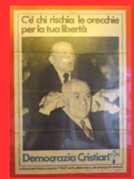
La satira ( Il male , locandina, 1979)