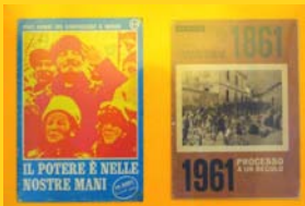
Il socialismo riformista ( Vie nuove )