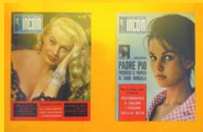
Rotocalchi e mondanità ( La settimana Incom )