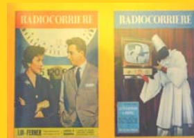
La nascita della televisione statale ( Radiocorriere )