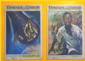
La conquista dello spazio e la decolonizzazione dell'Africa ( La domenica del Corriere )