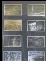
Guerra civile spagnola II