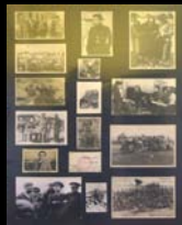
Guerra civile spagnola I