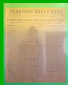
La "settimana rossa" ( Corriere della sera , 9 giugno 1914)