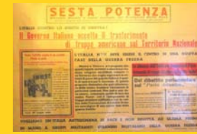
L'Italia confine di guerra ( Sesta potenza )