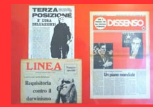
La destra extraparlamentare ( Terza posizione , aprile 1981, Dissenso , 15 febbraio 1981, La linea , 15 ottobre 1980)