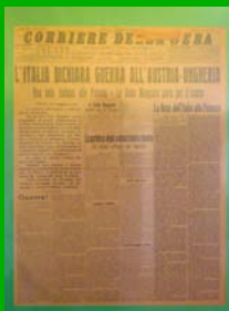
L'Italia entra in guerra ( Corriere della sera , 24 maggio 1915)