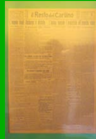
L'annuncio della vittoria ( Il resto del carlino , 5 novembre 1918)