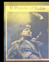
Il regime si celebra nel decennale della marcia su Roma ( Il popolo d'Italia , 28 ottobre 1932)