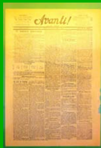
Quotidiani politici ( Avanti! , 25 dicembre 1896)