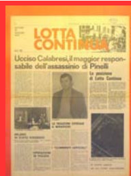
La sinistra extraparlamentare I ( Lotta continua , 18 maggio 1972)