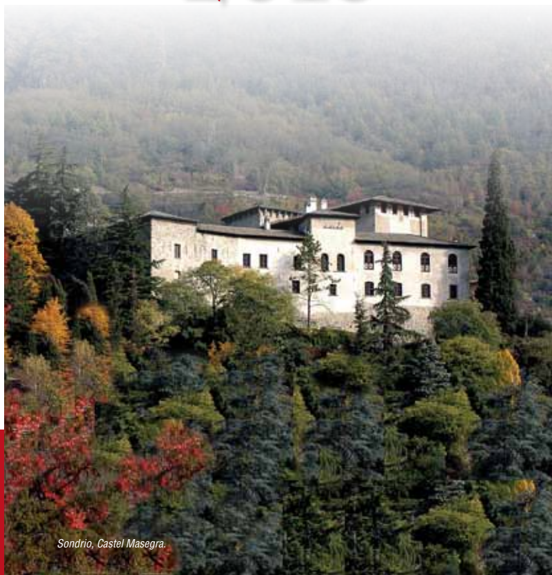
Liljo Polaris - Sondrio